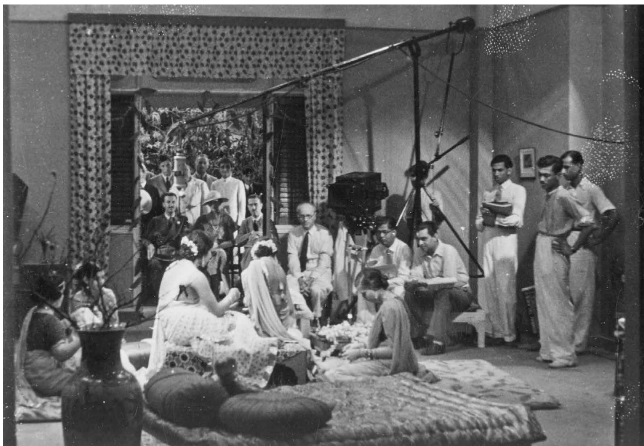
Der bayerische Adelige war als Filmarchitekt an zahlreichen Produktionen der Bombay Talkies Filmstudios – hier eine Szene aus einem der Filme – beteiligt.