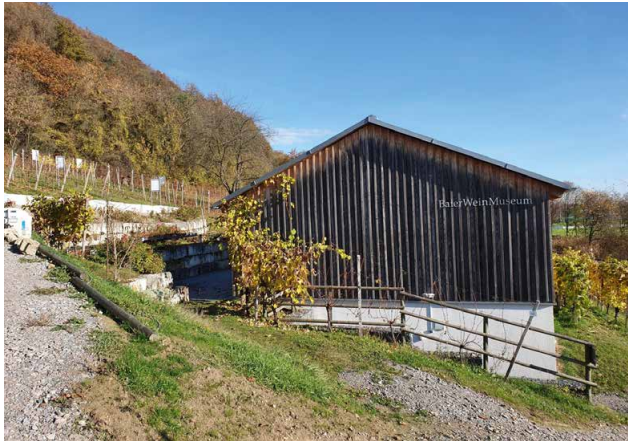
Das Weinbaumuseum in Bach an der Donau im Landkreis Regensburg: Das Museum zeigt unter anderem, wie bayerische Klöster in dieser Lage Wein anbauen ließen.