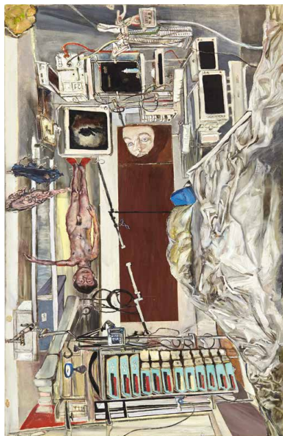
Abb. 8: INRI (2020)

mente eines heutigen Todes im sterilen klinischen Kontext zu enthalten. Dazu der Künstler: „Schulduweisungen sind, wie Du Dir sicher denken kannst, nicht meine Sache. Ich berichte lediglich. Enthält dieser Bericht nun den Tatbestand der Entfremdung vom eigenen Sterben? Sehen kann ich die Apparatur – was sich dahinter abspielt, nur erahnen. Atmosphärisch klingt da etwas an.“