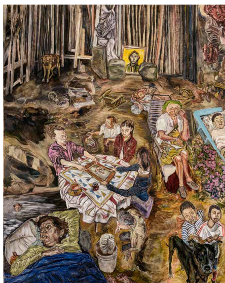
Abb. 3: Il caffè è pronto (2013)