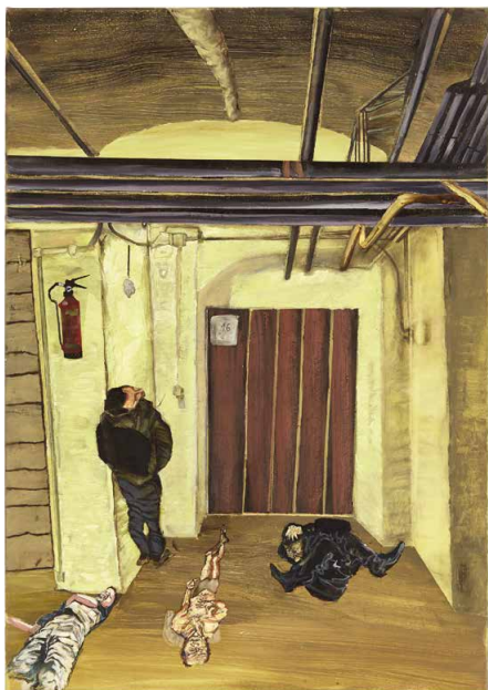
Abb. 2: Heizungskeller (2019)