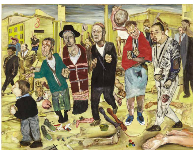
Abb. 5: Das Beinwunder der Chassidim (2020)

oder indirekt mit dem Kinderarzt und Widerstandskämpfer Georg Benjamin, der 1942 im KZ Mauthausen umkam, in Verbindung stehenden, um 2019/20 entstandenen Werke.