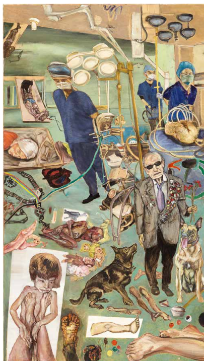
Abb. 9: Landesmeister mit Menzelfuß (2020)

Fast automatisch zieht man, wie hier, die Bildtitel als willkommene Interpretationshilfe zu Rate und muss immer