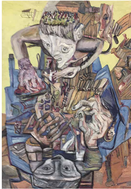
Abb. 6: Vierhändig / A quatro mani (2003)

Was kommt z. B. in Fensterfrau , 2019/20, (Abb. 7) nicht alles an Absonderlichkeiten zusammen! Auf gelbem, nach oben geklapptem und in einer gleichfarbigen Straßenschlucht mit gediegen wirkenden, mehrstöckigen Altbauten mündenden Boden findet sich eine aberwitzig disparate Gesellschaft, unterschiedlich proportioniert und ohne erkennbaren Bezug zueinander auf engem Raum. Alle Altersgruppen und Typen,