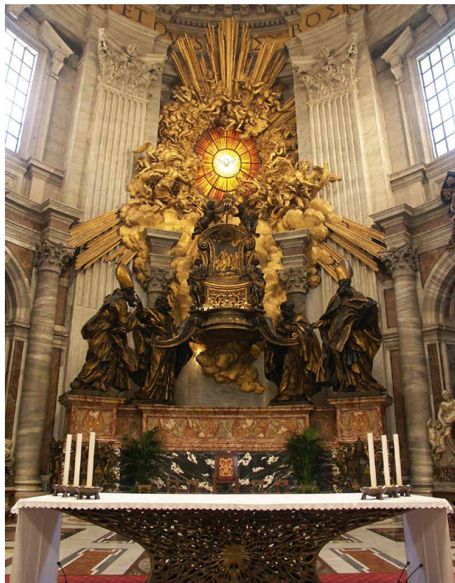
Cathedra Petri heißt eine stilisierte überlebensgroße Thron-Nachbildung innerhalb einer mehrteiligen Dekoration vor dem mittleren Wandabschnitt der Haupt-Apsis des Petersdoms in Rom, die 1657 bis 1666 von Gian Lorenzo Bernini im Auftrag von Papst Alexander VII. geschaffen wurde.

dem zudem, weil für die leibliche Aufnahme Mariens keine eindeutigen Schrift- und Traditionsbelege vorliegen, der sensus fidelium als eigentliche Begründung für das Dogma herhalten musste und somit einen faktischen Beitrag zur Dogmenentwicklung leistete. Inwiefern dieser einmalige Akt aus