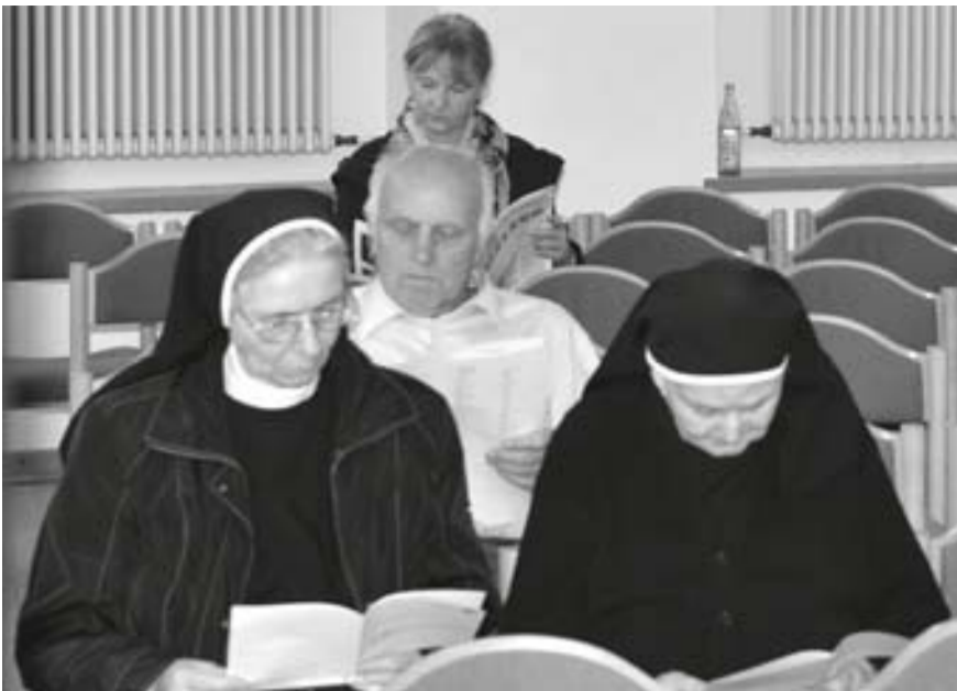
Besonders pünktliche Besucherinnen und Besucher nutzten im Vorfeld die Gelegenheit, die ausliegende Anmelde-

liste intensiv zu studieren oder in der aktuellen „debatte“ zu blättern.