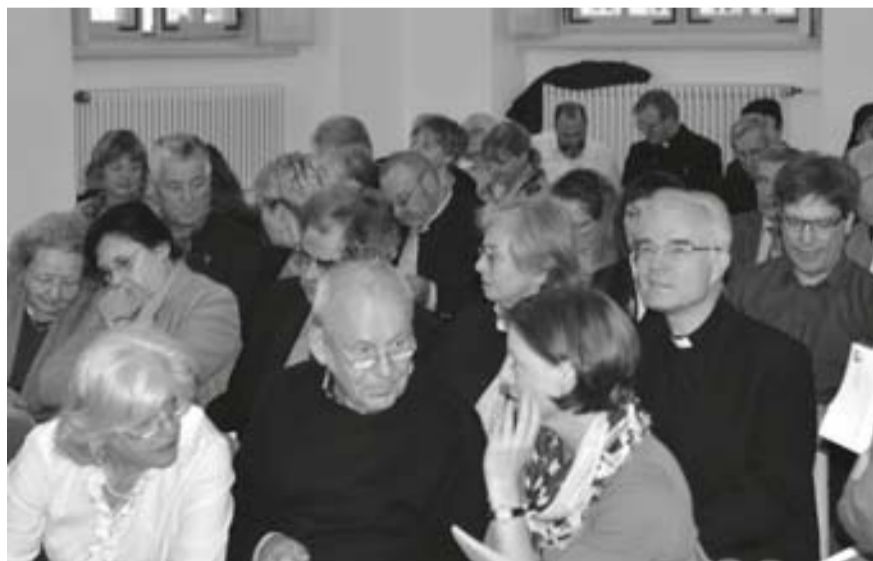
Zwischen den Vorträgen tauschten sich viele Zuhörerinnen und Zuhörer über das facettenreiche Thema des Abends – „Heilige“ – aus.