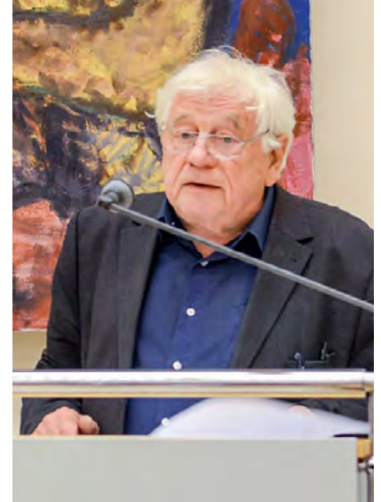
Prof. Dr. Wolfgang Benz, Zeithistoriker und Antisemitismus-Forscher

Mahnungen aus dem Exil und die Appelle der Alliierten, das deutsche Volk möge sich gegen die Diktatur erheben, blieben seinerzeit erfolglos. Die Mehrheit nahm das Unrecht, die Leiden des Krieges, den Terror des Luftkriegs hin, wollte von den Verbrechen des Regimes nichts wissen, allenfalls darüber raunen, jedenfalls darauf nicht widerständig reagieren. Beginnend im Zeitraum zwischen den Novemberpogromen 1938 und dem Überfall auf die Sowjetunion im Juni 1941 steigerte sich aber das Unbehagen in der Bevölkerung. Ausgelöst durch das vom Regime als Reichskristallnacht verballhornte Pogrom und ihre administrativen und legislativen Folgen war diese