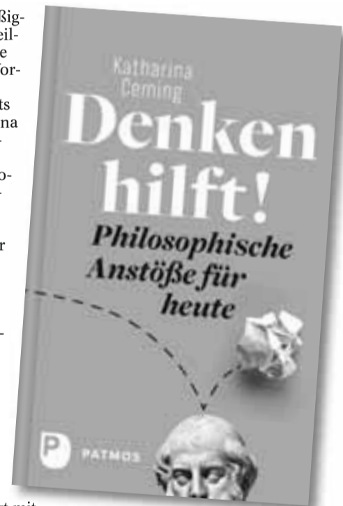
Das Cover des Buches von Katharina Ceming.

Nicht zuletzt seien heutzutage die fortschreitende Digitalisierung, die ständige Erreichbarkeit und das süchtigmachende Wischen auf dem Smartphone, nur um ja nichts zu verpassen, entscheidende Widerstände auf dem Weg zum Müßiggang. Hier gäbe es zumindest den Hinweis: sich in den sozialen Medien auf das beschränken, was dort