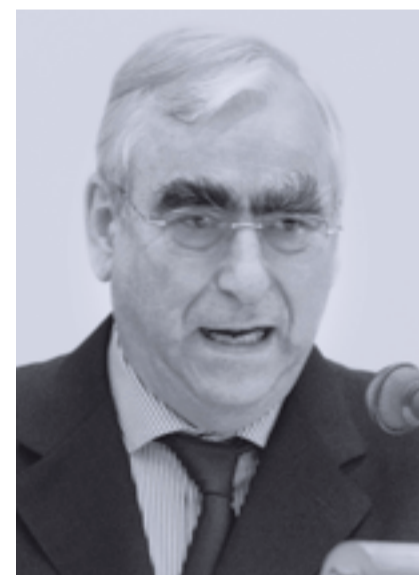
Dr. Theo Waigel, Bundesminister der Finanzen a. D., München

Die europäische Gemeinschaftswährung ist kein Werk europabesessener Politiker. Das Ganze hatte eine lange Vorlaufzeit. Schon in den ersten Parteiprogrammen der demokratischen Parteien nach dem Krieg stand eine gemeinsame europäische Währung als Ziel. Ich behaupte, der Euro liegt im existenziellen Interesse der deutschen Wirtschaft. Wenn Sie nachlesen, was Herr Cromme in einem Interview der „Süddeutschen“ dazu sagt, dann glaube