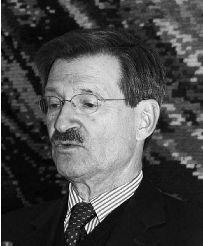
Dr. Hermann Otto Solms MdB, Vizepräsident des Deutschen Bundestages