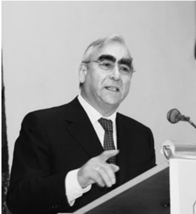
Dr. Theo Waigel, Bundesfinanzminister a.D.