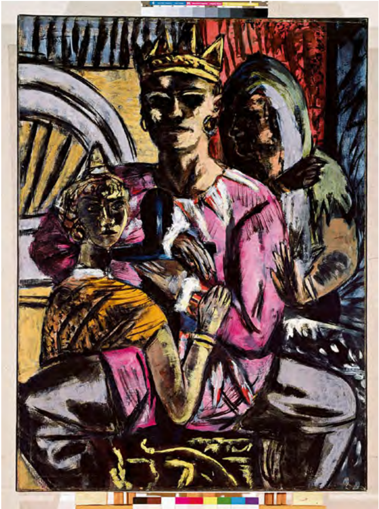
„Der König“ heißt dieses Gemälde Beckmanns. 1932 gemalt, überarbeitete es der Künstler 1937 in Amsterdam