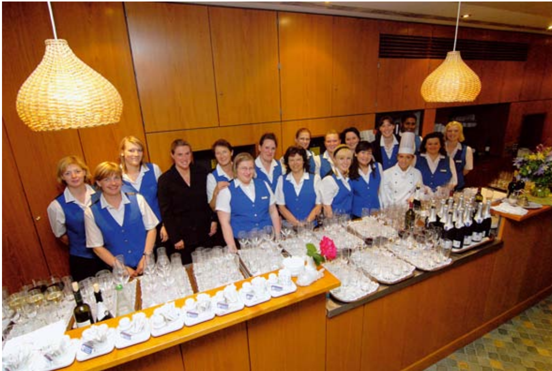
Viel Lob gab es für Küche und Service, die sich an diesem Festtag selbst überboten. Beim Essen und Trinken gab es Gelegenheit zu guten Gesprächen