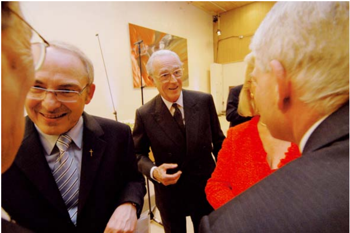
Herzog Franz von Bayern, Mitglied der Akademieleitung