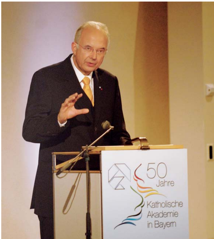
Prof. Dr. Paul Kirchhof, Bundesverfassungsrichter a. D., Heidelberg