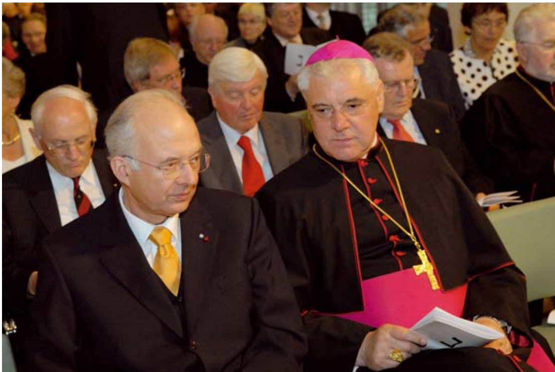
Der Regensburger Bischof Dr. Gerhard Ludwig Müller und Prof. Dr. Paul Kirchhof