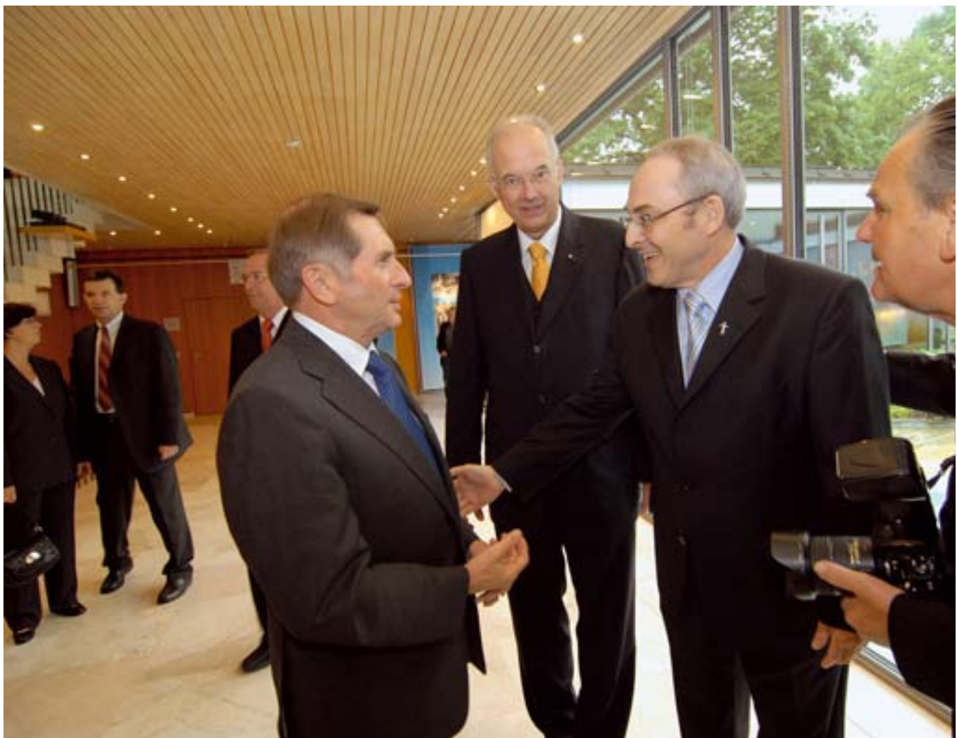
Ein herzliches Willkommen für Landtagspräsident Alois Glück