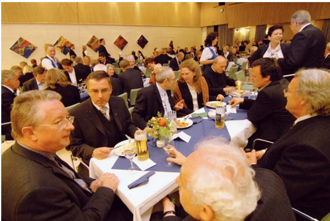
Der große Vortragssaal blitzesschnell umgebaut, diente den Gästen als Speisesaal