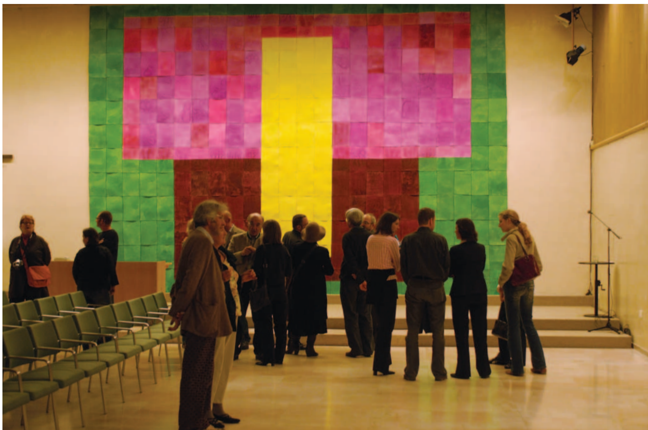
„Der Juwelenbaum“, ein aus Hunderten von Einzelpapieren und Einzelaquarellen zusammengefügtes Werk, schmückt die Stirnwand des großen Vortragssaals

Und schon sind wir wieder ganz nah bei Jon Grooms Arbeit. Bei seiner Glasarbeit. Und bei seinen Aquarellarbeiten. Es ist die Eigenheit dieser Aquarell-Technik, dass sie transparent wirkt, durchscheinend, schimmernd, gedeckt, verhalten oder licht. Und dass sie entsteht durch eine Art Metamorphose. Also durch einen Weg der Verwandlung. Vom Malgrund, dem Papier – schon das ist umgewandelte Pflanzenfaser – hängt das Verhalten des Wassers und damit der Farbe ab, und von der Nässe. Genauso auch von der Luft: Ist sie trocken, verhält sich die aufgebracht-